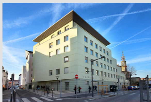
Campus de Lyon