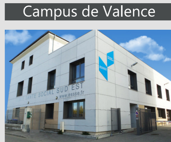
Campus de Valence