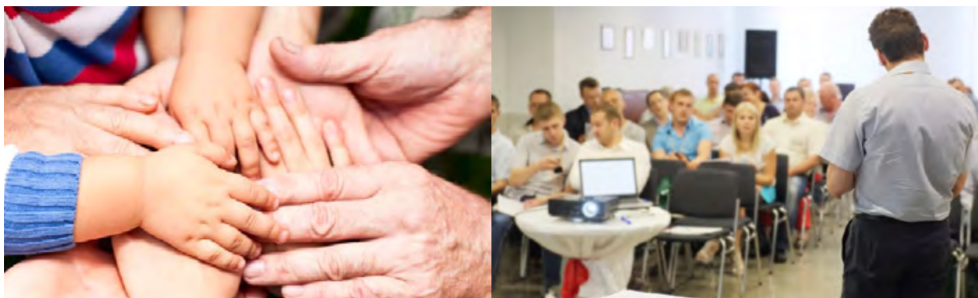
FORMATION CONTINUE POUR LES PERSONNELS DES CAISSES D'ALLOCATIONS FAMILIALES ET MSA

L'ESSE propose des formations en inter, dans ses locaux, ou sur mesure pour vos équipes dans vos structures.